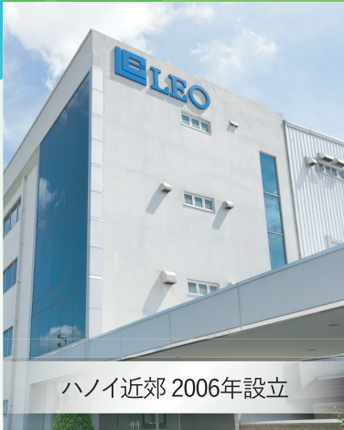
ハノイ近郊 2006年設立